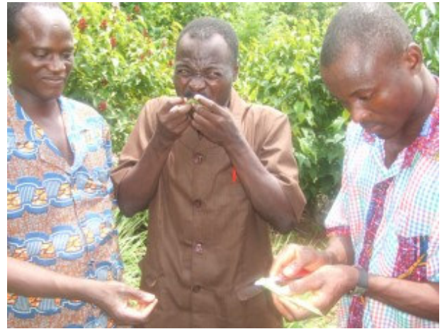
Seminarteilnehmer beim Kosten von Aloe während des Besuchs im Garten

Das Programm der beiden Seminar-Tage beinhaltete die Herstellung einer Salbe, das Bauen einer Waage, die Diskussion über das Moringa-Video und der Besuch in Gbatis Medizinischem Garten. Wie immer, säten wir Artemisia Samen aus und sprachen über die Verwendung der Pflanze.