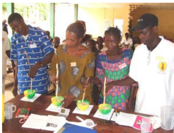
TeilnehmerInnen des Seminars beim Herstellen von Seife