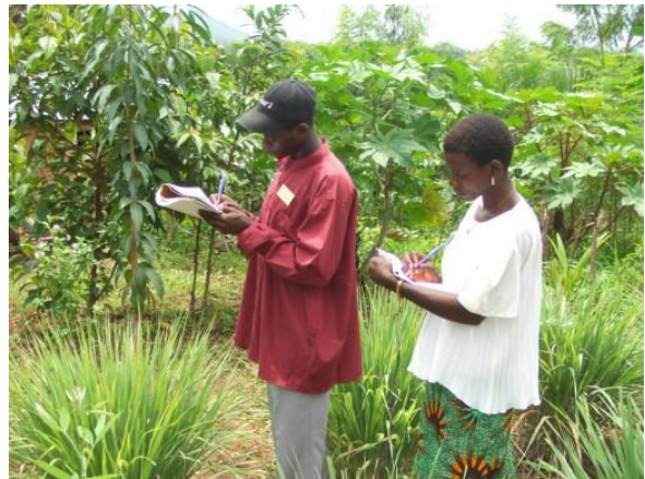
Der Besuch im medizinischen Garten ruft viel Interesse hervor